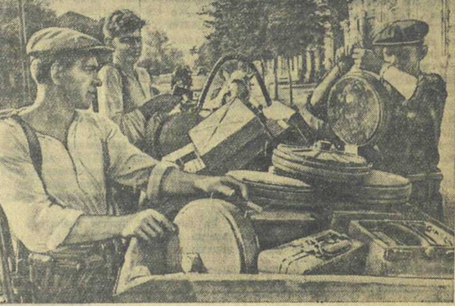
В ОСВОБОЖДЁННОМ ТАГАНРОГЕ. 1. Группа партизан, возвращающихся в родной город. 2. Одно из разрушенных немцами зданий на центральной улице города. 3. Таганрогские рабочие помогают собирать брошенными немцами мины и другое военное имущество. (Доставлены на самолёте лёгких вылетов Мех. Скрябинскими).